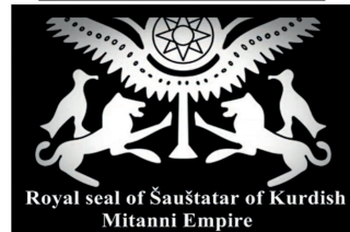
Royal seal of Šaušatar of Kurdish Mitanni Empire